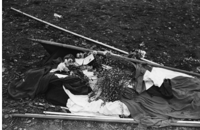
A Köztársaság téri (II. János Pál pápa tér) pártház ostroma során elesett forradalmár letakart holtteste