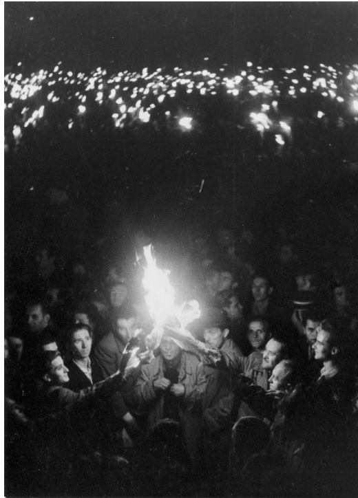
Kossuth Lajos tér, fáklyás tüntetés 1956. október 23-án a Parlament előtt