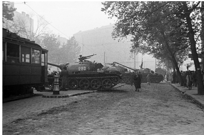
A Múzeum körút a Kálvin tér felé nézve

Orosz tankok a Kálvin téren – egész ostromállapotok! Gondviselő – vigyázz, kérünk – erre a népre!