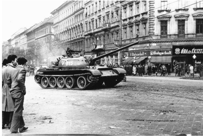
Lenin (Teréz) körút – November 7. tér (Oktogon) sarok. A szovjet csapatok ideiglenes kivonulása 1956. október 31-én