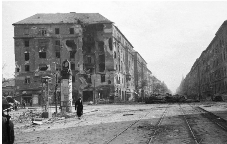
Üllői út – Nagykörút kereszteződés, Üllői út a Nagyvárad tér felé nézve